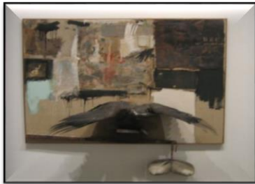
شكل (٢) كانيون / روبرت راوشنبرغ / ١٩٥٩

اعتمد فنانون الفن الشعبي على العناصر الواقعية في الحياة، اي الصور والسيارات والسينما والعلب وغيرها من المواد التي تعكس الواقع الاجتماعي لهم ليتداخل الفن بالحياة، وهذا دفع النحات الى خوض تجارب أكثر جرأة مع المواد المتنوعة بالاعتماد على الاغتراب بالتقنية، إذ إن اعمالهم هي صياغة لواقع ومجتمع عاش ويعيش فيه النحات، فضلاً عن انها وصف لحياتهم عن طريق استخدام مواد قدمتها لهم بيئتهم الاستهلاكية والصناعية فجمعوا بذلك بين مظاهر حياتهم الاجتماعية وبين نتاجاتهم النحتية للتعبير بالشكل النحني والمضمون عن اغتراب تقني يعد حالة ابداعية (Al-Basiouni, nd, p. 295).