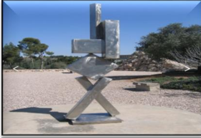
شكل (١) كيوي / ديفيد سميث / ١٩٦٣

نتيجة للتحويل الكبير الذي طرأ على الفن/النحت خاصة من ناحية الشكل والتقنية التي اعطت الحرية للنحات لإنتاج اعمال