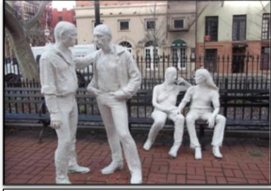
شكل (٣) في الجامعة/ جورج سيجال/ ١٩٧٩

ومن اهم نحاتي الواقعية المفرطة (جورج سيجال) الذي استمد مواضيع منحوتاته من الحياة اليومية وكان ينحتها من مواد متنوعة كالمعدن والجص والفايبر كلاس ويطلبها باللون الابيض، وقد عبرت عن مواضيع حياتية كعبور الشارع او محاوره بين اشخاص وغيرها، ومما زاد من قربها من الحياة اليومية اكثر هو استخدامه لمواد من الواقع كإدخال دراجة او كرسي وغيرها من المواد في المشهد المنحوت ليتفاعل معها المتلقي وكأنه جزء منها ليحولها بذلك من حالة الجمود الى حالة الحركة التي يمارسها الانسان/ المتلقي في حياته اليومية كما في عمله (في الجامعة، شكل ٣)، اما (دون هانسون) فقد اشتغل منحوتاته على نفس طريقة (جورج سيجال) إلا انها عولجت بدقة اكبر عن طريق ادخال اللون والملابس والاثاث وغيرها من المواد