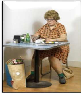
شكل (٤) امرأة تأكل/ دون هانسون/ ١٩٧١

المستخدمة في الحياة اليومية لتكون متطابقة اكثر مع الواقع وهذا ما زاد من اغترابها كونها بعيدة عن المؤلف المتداول لدرجة محاكاتها العالية له (اي للواقع)، وكانت مواضيعه تتمحور حول الجالسين في المطاعم وعمال البناء وغيرها من شرائح المجتمع كما في عمله (امرأة تأكل، شكل ٤)، مما اثار طابع الدهشة والغربة وحالة الاغتراب في النحت غير المتداول بأفكاره وتفصيله الدقيقة، إذ ((تخطى بمنحوتاته الواقع نحو بناء تماثيل دقيقة التفاصيل مكثفة لعنصر الجمال... فمنحوتاته منجزة بعناية كبيرة ابتداءً من الجسد والملابس وكل المستلزمات المضافة له والمنقاة بعناية لتلائم منجزه الفني الذي يتناول امور واقعية متعددة من اشخاص نفذوا بوضعيات مختلفة ومهن متعددة حاول تسليط الضوء عليها بعقلانية نافذة وكاشفة لأعمالها وتعابيرها ومعاناتها، وكل ما يمسه من واقعها الاجتماعي وله تأثير على سلوكها وتعابيرها)) (Youssef, 2024, p. 238).