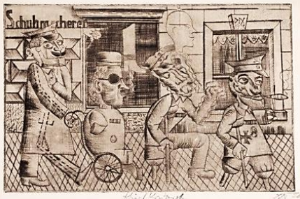
شكل (٢) مشلولي الحرب

صوّر (ديكس) ثلاثة من قدامى المحاربين الذين خاضوا الحرب بملاح مشوّهة إبقاء النار مشتعلة ليلاً بشكلٍ صارخ، مع التركيز على أجسادهم التي دمرتها الحرب من خلال إظهار أطرافهم المبتورة فمنهم من يتكئ على العكازات وآخر يجلس على كرسي المقعدين. (Orley, 2018, p. website) كما في الشكل (٢) ** لقد سعى الفنان (ديكس) إلى الكشف عن حقائق عصره، التي هيمن عليها عنف الحرب والفرع والخوف والترهيب، وعمل على انجاز أعمال ذات تفاصيل غريبة تضمّنت مشاهد تحمل روح اليأس والإشمئزاز والوحشية. وبحسب (ديكس) تُعد الحرب شيئاً فظيماً، التي امكن من خلالها معرفة الطبيعة البشرية. كما نجد اهتمام الفنان بالفلسفة الوجودية ل(فريدريك نيتشه) من خلال هول الأحداث وتأثيرها بالنفس البشرية، والخوض في أعماق التجربة الحياتية التي