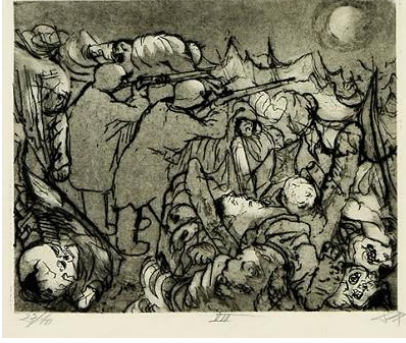
شكل (١) يتعين على الحراس

ان صور الفنان (اوتو ديكس) الفنية المطبوعة التي برزت في اعماله المبكرة حملت دلالات على المهارة التخطيطية الهائلة والعناية الفائقة بالتفاصيل مما ترك تصوراً تلقائياً مفزَعاً تجاه الأحداث الاجتماعية والموضوعات المرعبة التي شهدتها في اثناء حرب الخنادق. لقد انتابه النفور الشديد من لا أخلاقيات الحرب، انتج بعدها لوحات جسدت القسوة البشرية ومعاناتها، حيث الواقعية المذهلة في تصوير مظاهر البؤس والدمار والموت، عبر صورٍ للوحات فنية ذات سمات تخريبية ومشاهد تحمل اثاراً مقصودة لإبراز موضوعات الإنحطاط الخلقي. (Khalil, vol 3, 2005, pp. 179-180) لكن نتاجاته